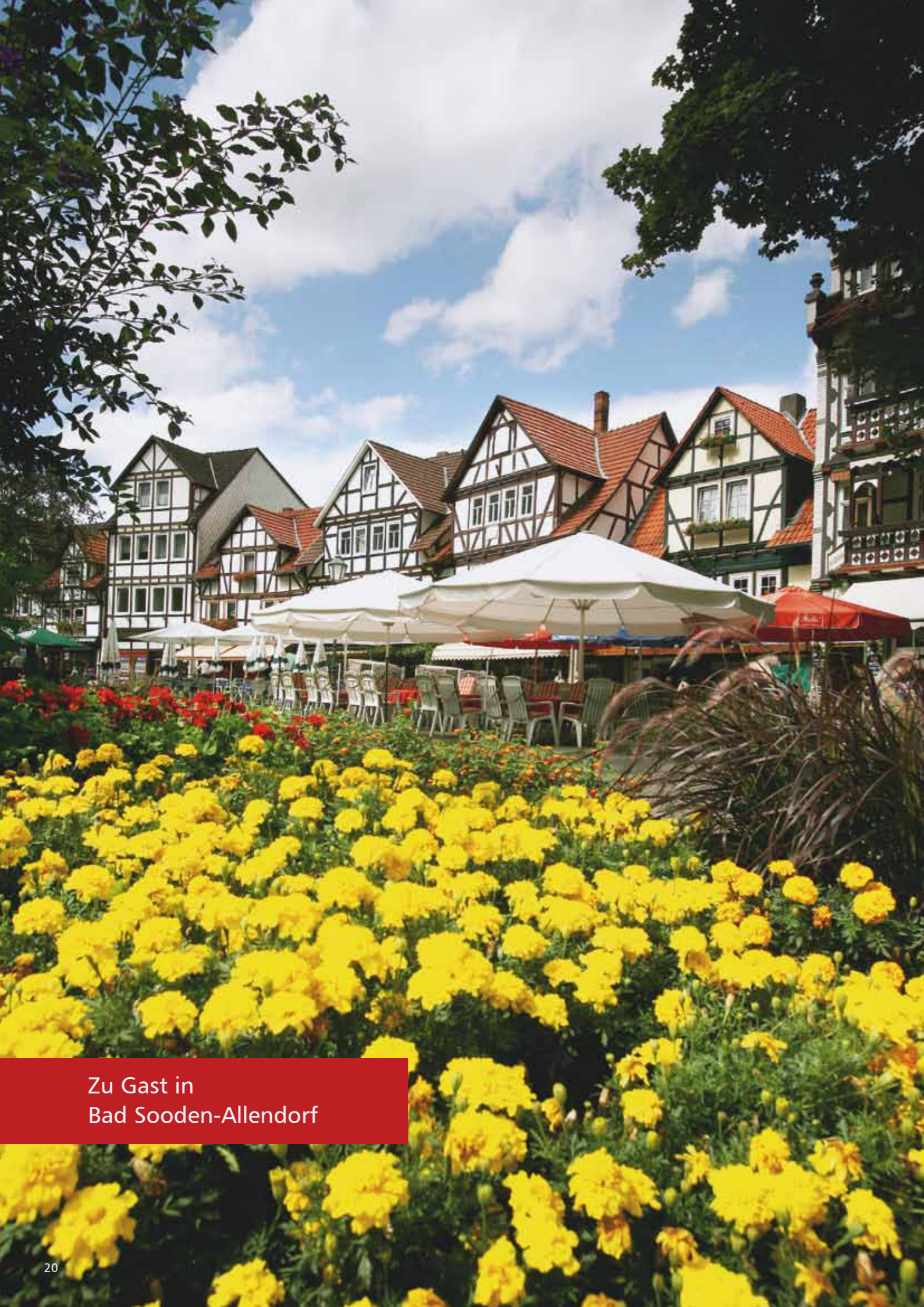
Zu Gast in Bad Sooden-Allendorf